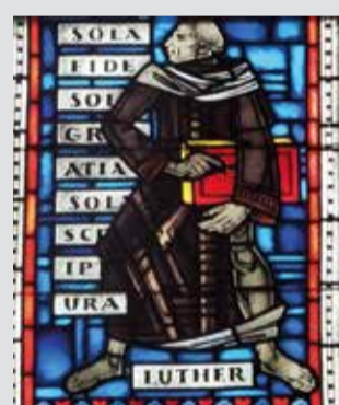
Glasfenster in Speyer mit den drei Prinzipien der Reformation, Foto Burkhard Vogt.

Mittwoch, 26.04.2017, 19.30 Uhr Tettngang, Katholisches Gemeindezentrum St. Gallus, Wilhelmstraße 11 (barrierefrei)