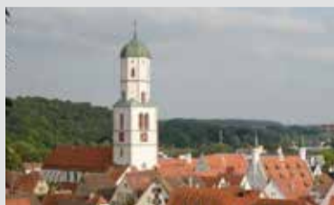
Die paritätische Stadtkirche über den Dächern von Biberach.

Mittwoch, 17.05.2017, 19.30 Uhr Biberach, Martin-Luther-Gemeindehaus, Waldseer Straße 18 (barrierefrei)